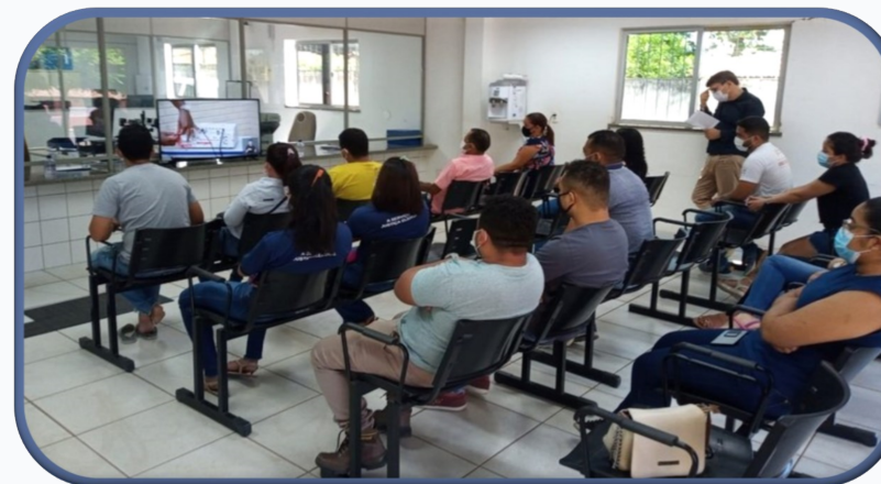
Treinamento de Coordenadores (as) de Acessibilidade - Uruaçu