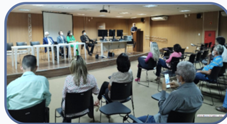
Audiência pública de encerramento das inspeções nos cartórios eleitorais de Teresina-PI (1ª, 2ª, 63ª, 97ª e 98ª Zonas Eleitorais) no dia 29.11.2022