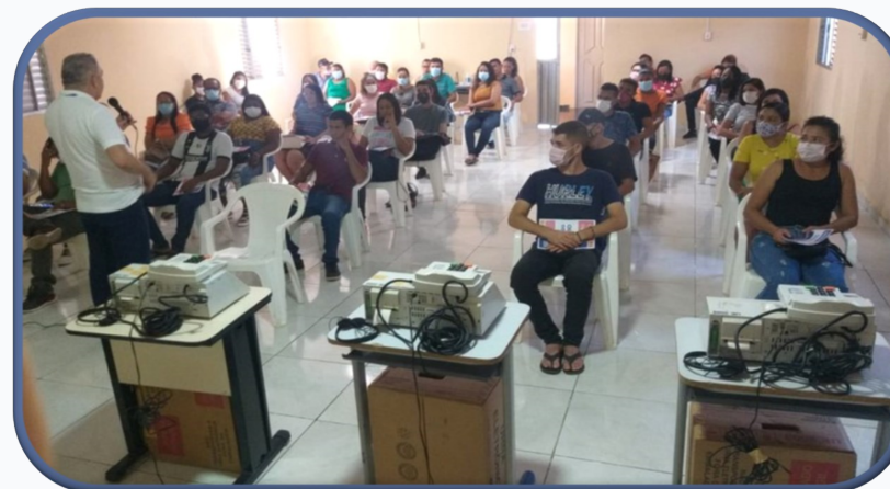
Treinamento de Coordenadores (as) de Acessibilidade - São João do Piauí