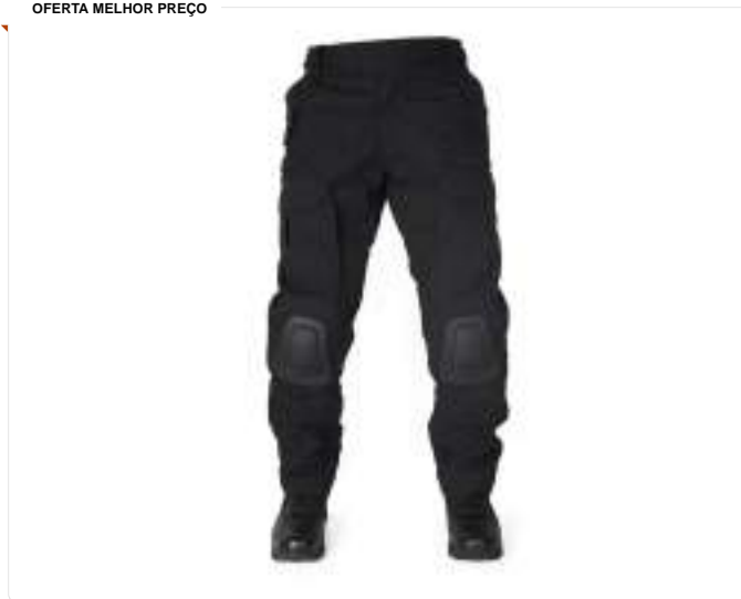
Calça Tatica Com Joelheira F3 Preta - Forhonor