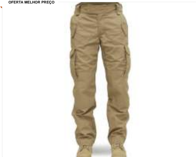
Calça Forhonor 911 Desert - Tatica, Militar, Airsoft, Ripstop