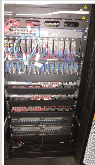
Imagem 01 - Rack da antessala do Datacenter primário do TRE-PI