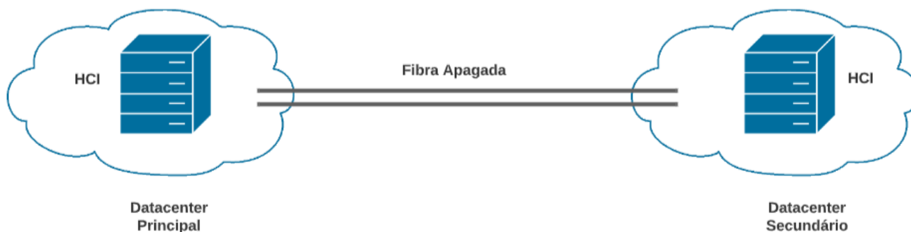
Figura 2: Proposta de comunicação digital entre os datacenters do TRE-PI

De maneira simplificada, todas essas soluções juntas propiciarão a criação do seguinte cenário: