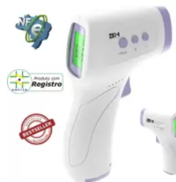
TERMÔMETRO INFRAVERMELHO - HZK