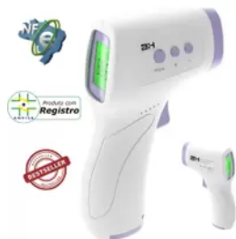
TERMÔMETRO INFRAVERMELHO - HZK