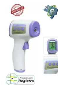
Termômetro Digital Infravermelho - ANU