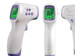
Termômetro Digital Infravermelho - mediç