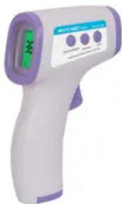
Termômetro Infravermelho HC 260 de Testa...