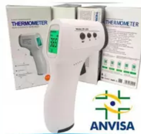
Termômetro Digital Infravermelho - ANVIS...