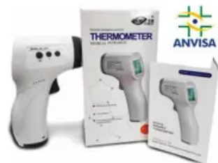
Termômetro Digital Infravermelho - ANVIS...