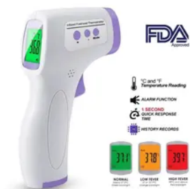
Termômetro Digital Infravermelho TESTA -...