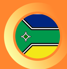
Tribunal Regional Eleitoral do Amapá