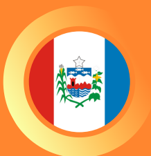
Tribunal Regional Eleitoral de Alagoas