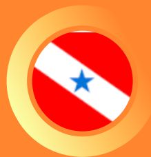
Tribunal Regional Eleitoral do Pará