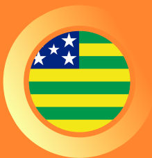
Tribunal Regional Eleitoral de Goiás