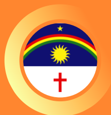
Tribunal Regional Eleitoral de Pernambuco