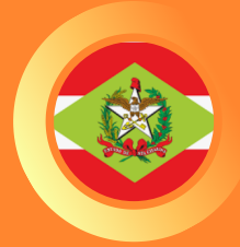
Tribunal Regional Eleitoral de Santa Catarina