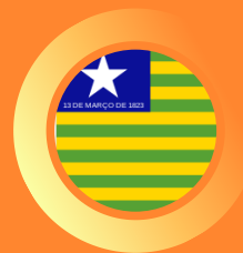
Tribunal Regional Eleitoral do Piauí