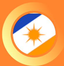
Tribunal Regional Eleitoral do Tocantins