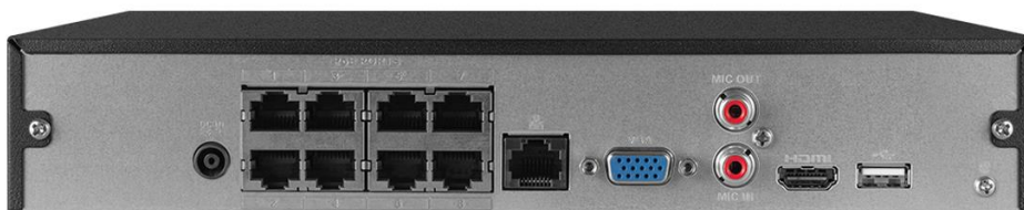
Vista traseira NVD 3308-P