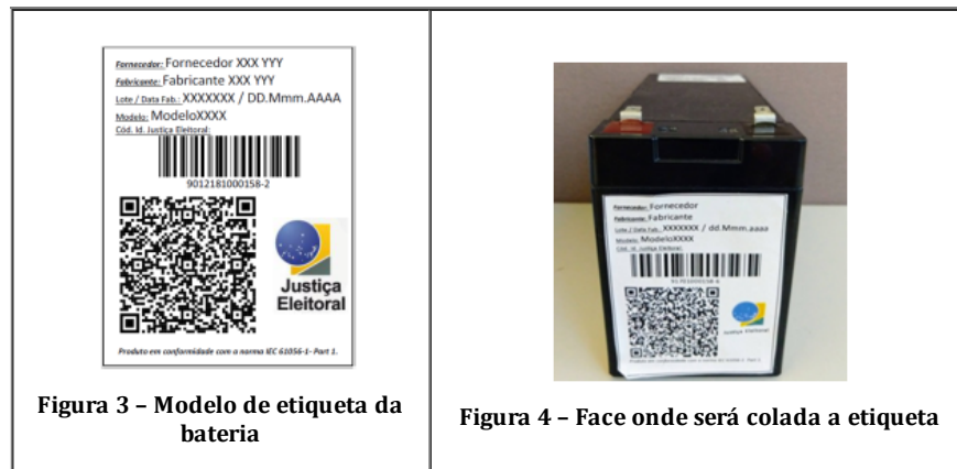
Figura 3 – Modelo de etiqueta da bateria

23.3.10. Logotipo da Justiça Eleitoral (ao lado do QR Code);