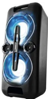
Caixa Acústica Philco PCX5001N Bluetooth