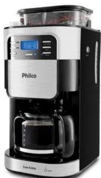
Cafeteira Philco Grano Perfetto PCF22PI